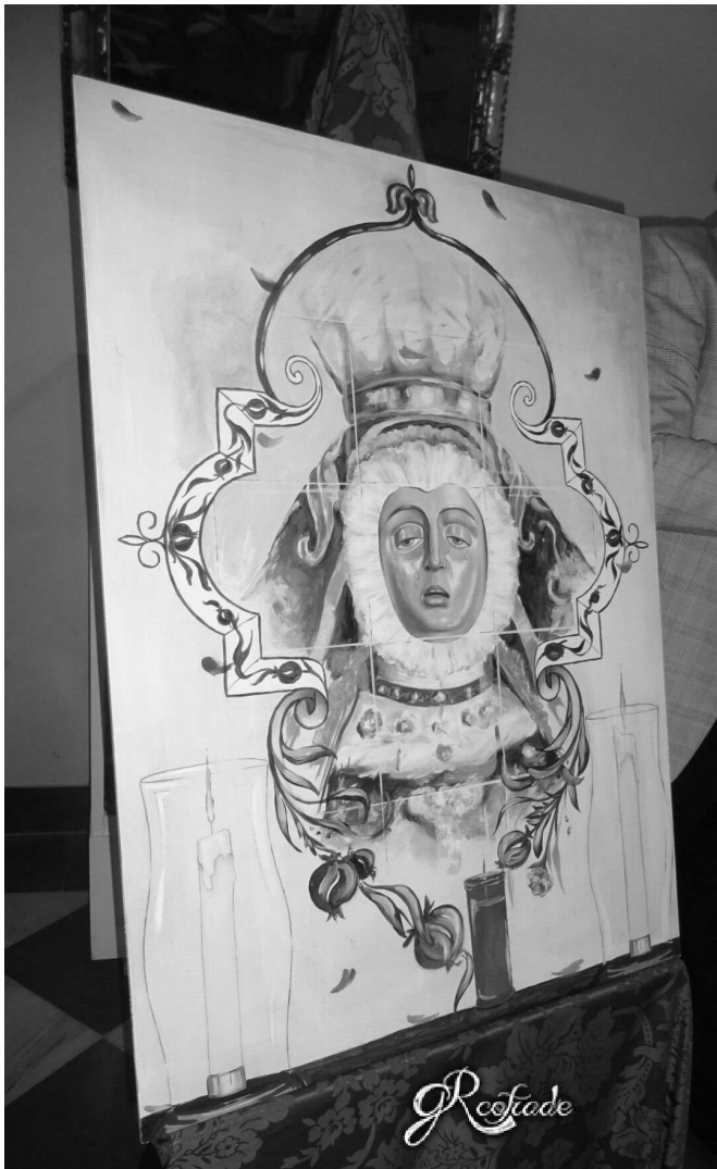
Cartel Ofrenda Floral Angustias, obra de Javier Mateos.